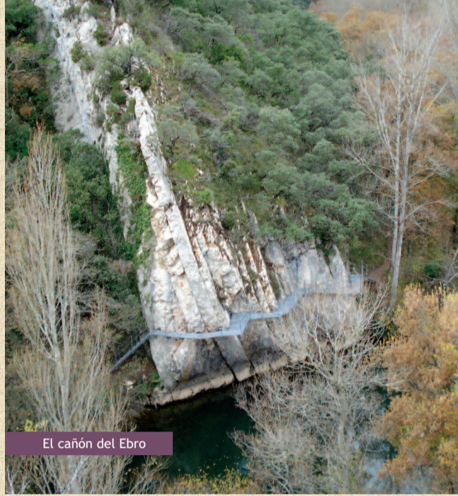
El cañón del Ebro

El Camino Natural comienza en el paraje de Fontibres, cuyo nombre deriva del romano Fontes-Iberis , Fuentes del Ebro, enclave del nacimiento del río, junto al Centro de Interpretación del Ebro, y termina en Riumar, a orillas del Mediterráneo. Su longitud es de 1.287,32 km y atraviesa ordenadamente las Comunidades Autónomas de Cantabria, Castilla y León, País Vasco, Navarra, La Rioja, Aragón y Cataluña.