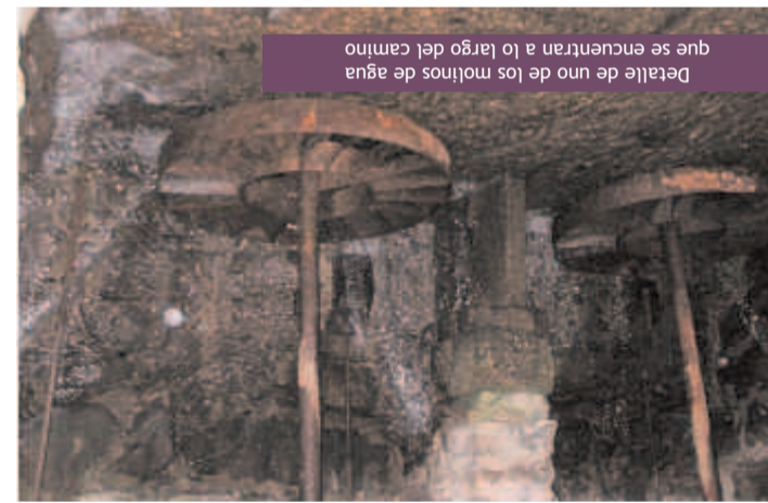
Detalle de uno de los molinos de agua que se encuentran a lo largo del camino

1. Además de los numerosos vestigios arqueológicos del románico medieval, en este tramo merecen destacarse valores naturales tan excepcionales como el Parque Natural Hoces del Alto Ebro y Rudrón y sus sinuosos meandros, lugar de reproducción de buitres, halcones peregrinos y águilas reales, entre otras especies. TRAMO 2º: QUINTANA MARTÍN GALINDEZ (BURGOS) - ALCANADRE (LA RIOJA) La segunda sección de este recorrido ofrece al viajero numerosos ejemplos de arquitectura de montaña. El Camino Natural abandona la comarca de Las Merindades para llegar a tierras riojanas transcurrendo entre pinos, quejigos y bojís. TRAMO 3º: ALCANADRE (LA RIOJA) - ALAGÓN (ZARAGOZA) El río va entrando en la depresión de su mismo nombre ofreciendo una gran variedad de formaciones de ribera. Sus márgenes se van