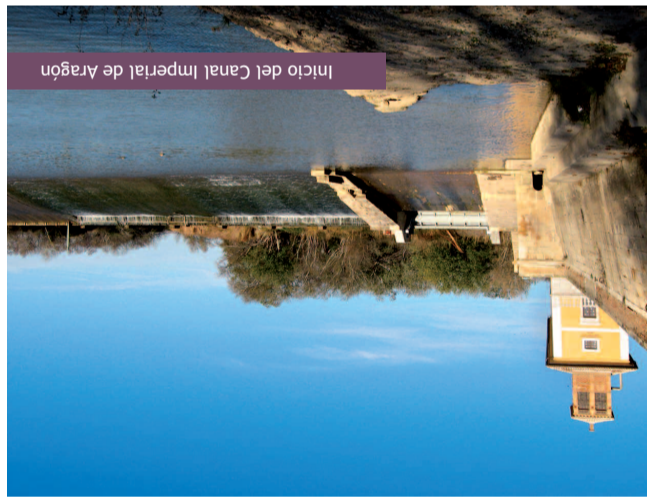
Inicio del Canal Imperial de Aragón

La magnitud de la cuenca, con un cauce de más de 900 km, permite la sucesión y solapamiento de múltiples paisajes, desde la alta montaña al mar, a través de los desiertos de Las Bardenas Reales y de Los Monegros, lo que procura una enorme biodiversidad de especies de fauna y flora.